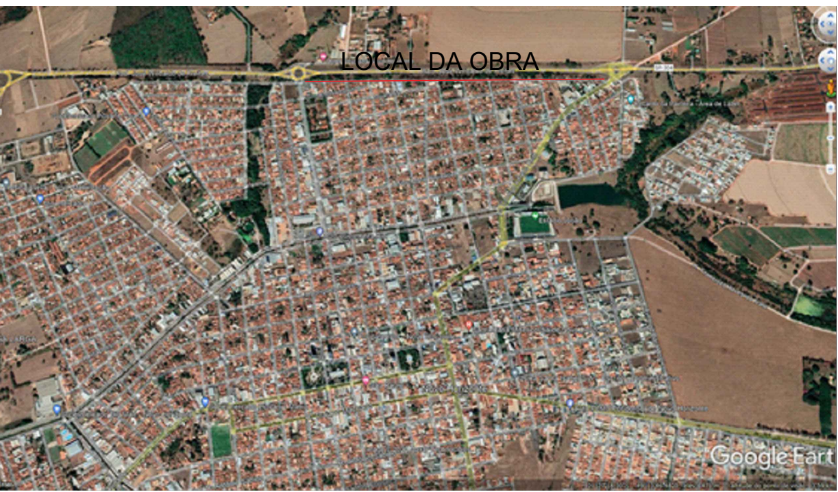
GOOGLE EARTH SEM ESCALA

* Piso em ladrilho hidráulico podotátil - COR AMARELO (30x30cm), assentado com argamassa mista